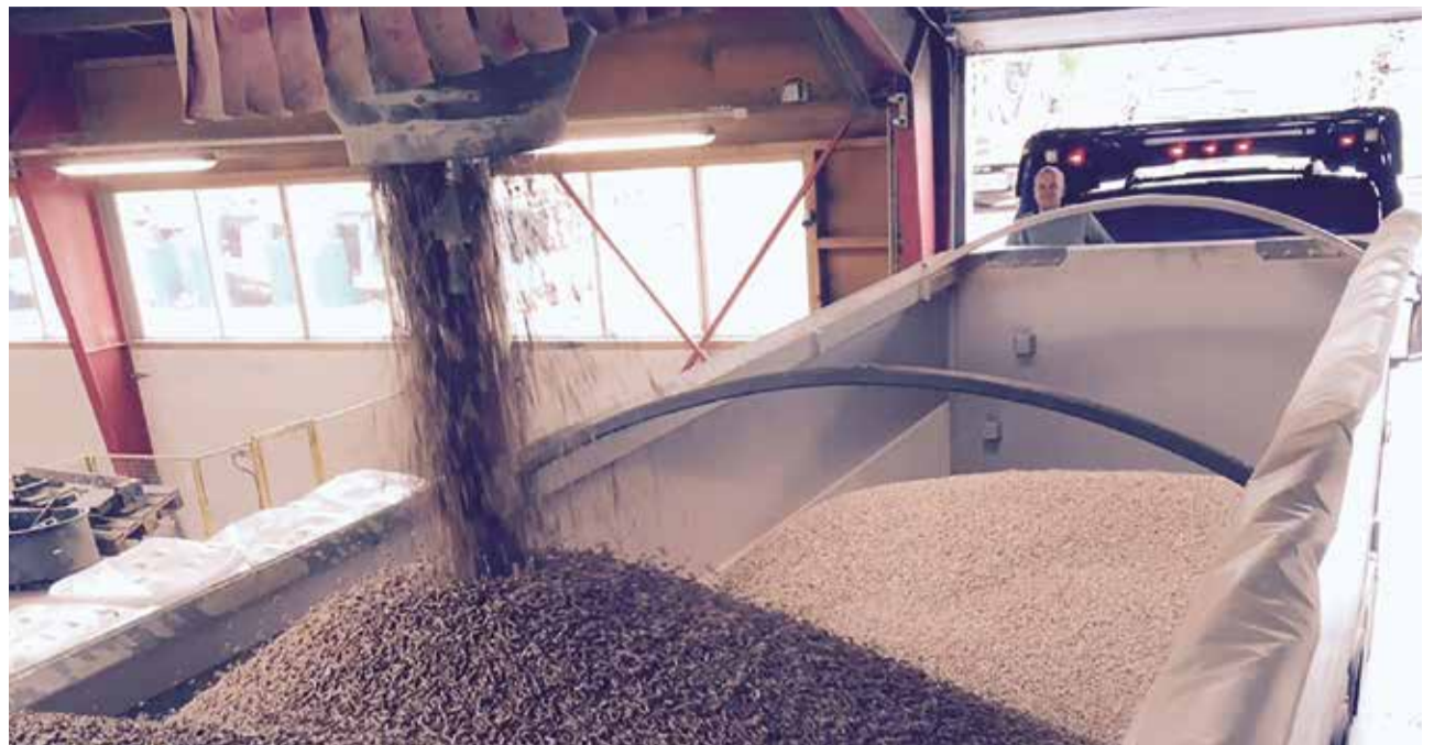
Die RPellets für das neue Lager in Kiel stammen ganz aus der Nähe.

Hier im Bild die Verladung im dänischen Ribe.