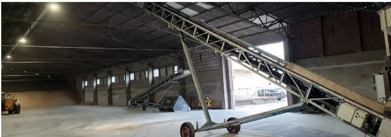
Das ENplus-zertifizierte Lager im thüringischen Gotha hat eine Kapazität von 2.500 Tonnen.

Die Raiffeisen Bio-Brennstoffe GmbH baut ihr dezentrales Lagernetz stetig weiter aus. Neben den Lagerstätten der team energie GmbH in Hanerau und Fehrbellin ist der Standort Gotha neu hinzugekommen. Es handelt sich um ein ENplus-zertifiziertes Lager bei der Baro Lagerhaus GmbH, einer Konzerngesellschaft der AGRAVIS Raiffeisen AG. Die Halle bietet eine Kapazität von 2.500 Tonnen. „Von dort können unsere Partnerhändler ihre Kunden in den östlichen Bundes-